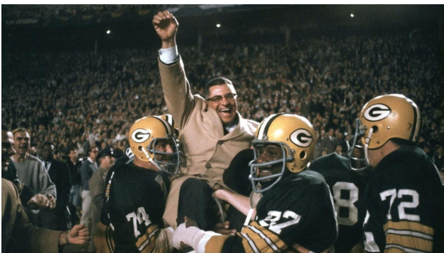
วินซ์ ลอมบาร์ดี (Vince Lombardi)